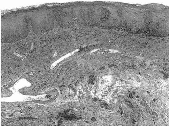
写真4 初回生検時の病理組織像(H-E染色, ×40) 上皮の肥厚と炎症性細胞浸潤は認めたものの悪性所見はなかった。